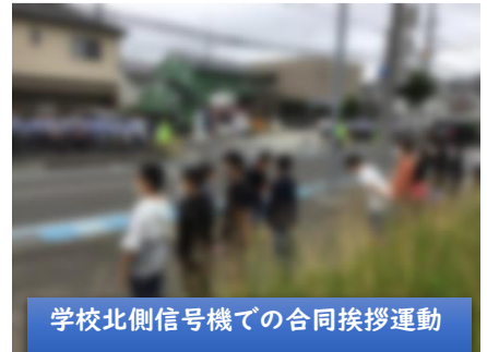
学校北側信号機での合同挨拶運動

つい先日、2回目の挨拶リーダーが選ばれました。各学級で、挨拶の立派な人が多くなり、誰をリーダーにするかを担任が悩む姿が見られるほどでした。みんなが挨拶リーダーになるといいと思います。また、23日(水)の朝に小・中・高等学校による合同挨拶運動が行われました。小学校からは、計画委員会と生活委員会の児童が参加しました。「おはようございます。」という声が響き合い、朝から清々しい気持ちになりました。