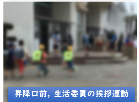
昇降口前、生活委員の挨拶運動